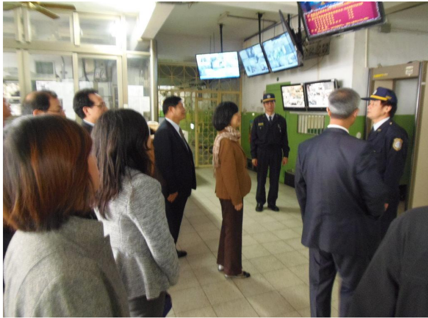
(羅部長瑩雪訪視戒護區各單位實景)

法務部羅部長瑩雪於歲末年終，樸樸風塵訪視新竹地區所屬各機關，於12月23日下午2時40分許由矯正署吳署長憲璋一行人等陪同訪視法務部矯正署新竹看守所，該所祀所